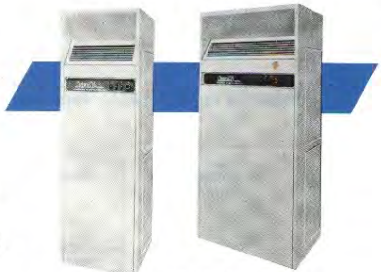
Modelo COP 15